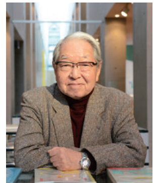
初代館長 細江英公

20世紀を代表する世界的写真家の1人であり、1995年7月の清里フォトアートミュージアム開館より初代館長を務めた細江英公。世界の若手写真家を支援する公募・選考・展示・収蔵を行う「ヤング・ポートフォリオ」(YP) を創設・牽引し、後進の育成に情熱を注ぎ続けました。本展では、細江英公館長へのオマージュとして、写真集、著作を自由に閲覧いただけるスペースをご用意いたします。